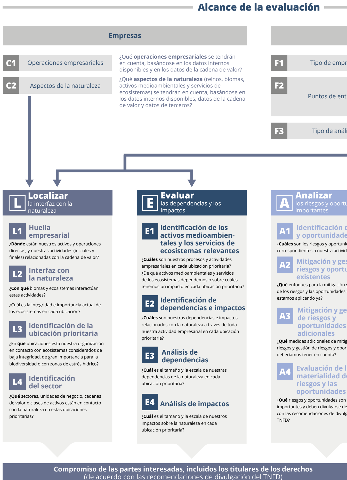
Figura 4: El enfoque revisado para la evaluación de riesgos y oportunidades del TNFD (LEAP)