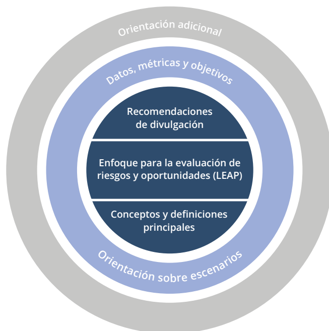
Figura 1: Componentes principales del marco del TNFD

Las actualizaciones más importantes del marco beta en la v0.3 son: