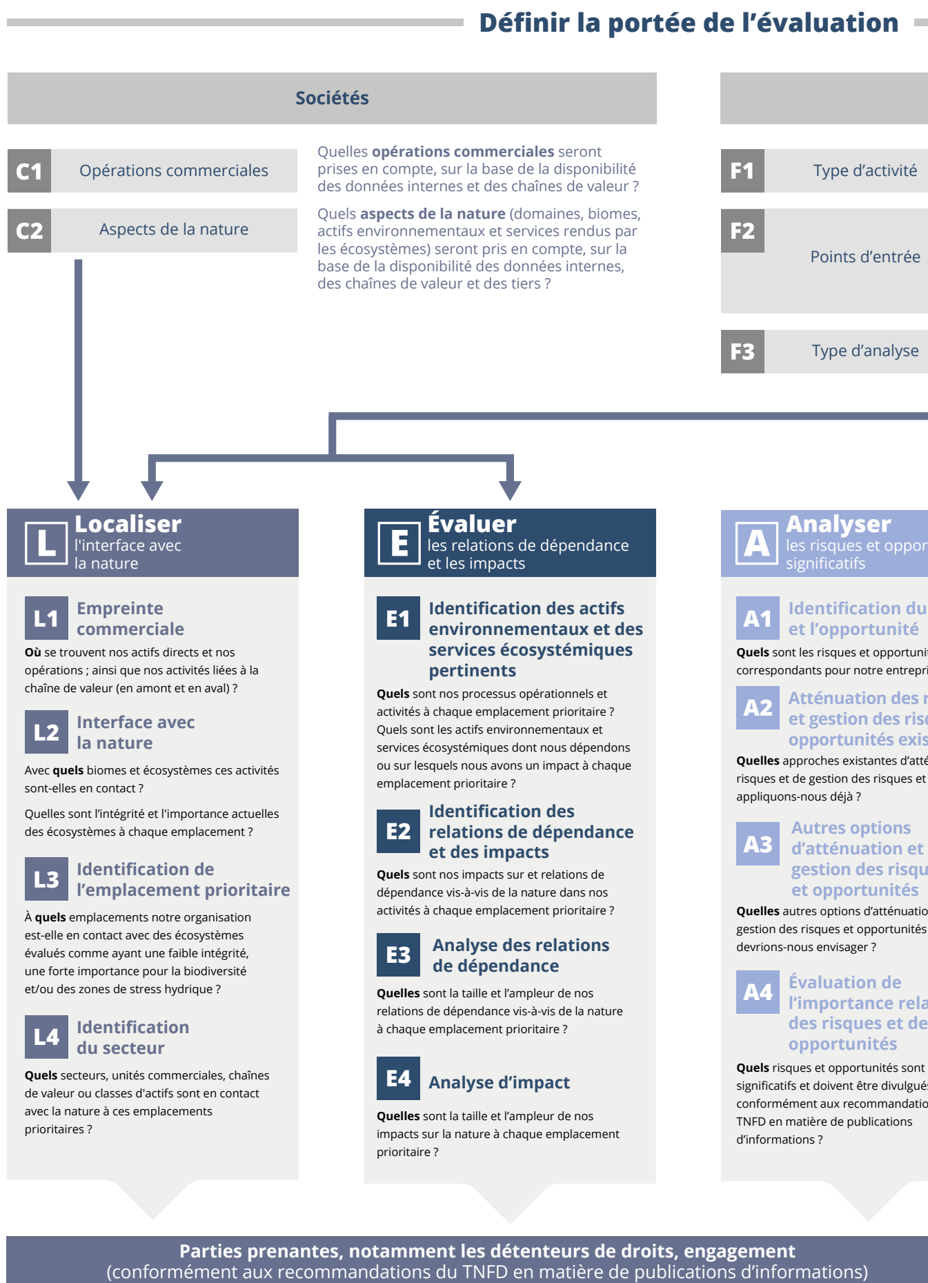
Figure 4 : L'approche révisée d'évaluation des risques et des opportunités (LEAP) du TNFD