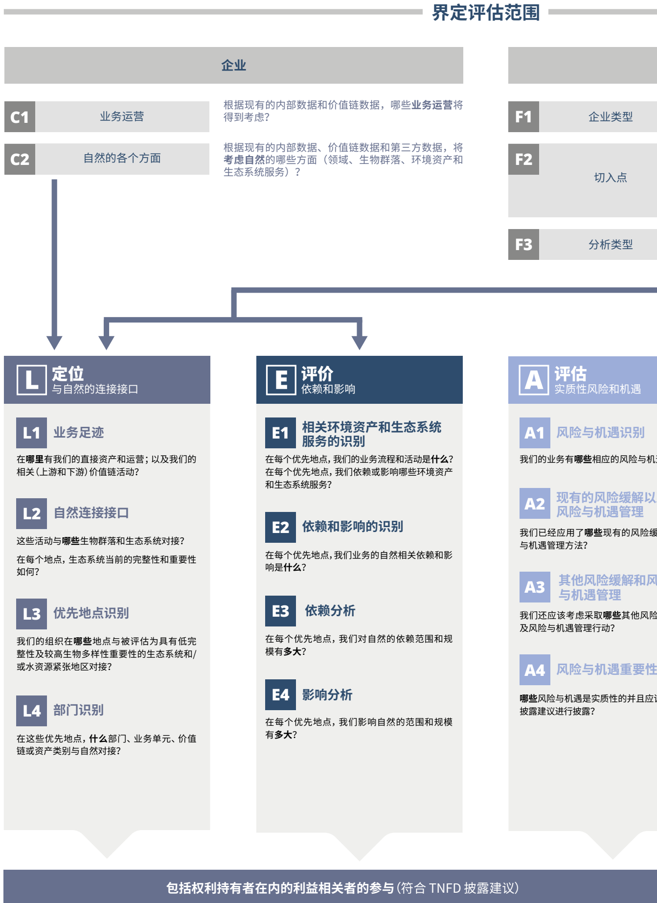
图 4：TNFD 修订后的风险与机遇评估方法（LEAP）