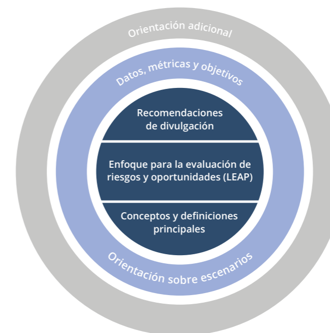
Figura 1: Componentes principales del marco del TNFD

Las actualizaciones más importantes del marco beta en la v0.3 son: