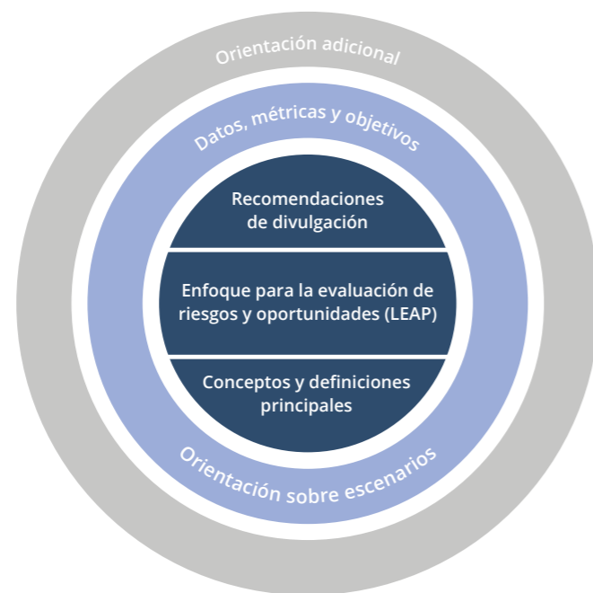
Figura 2: Actualizaciones del marco beta del TNFD en la v0.3