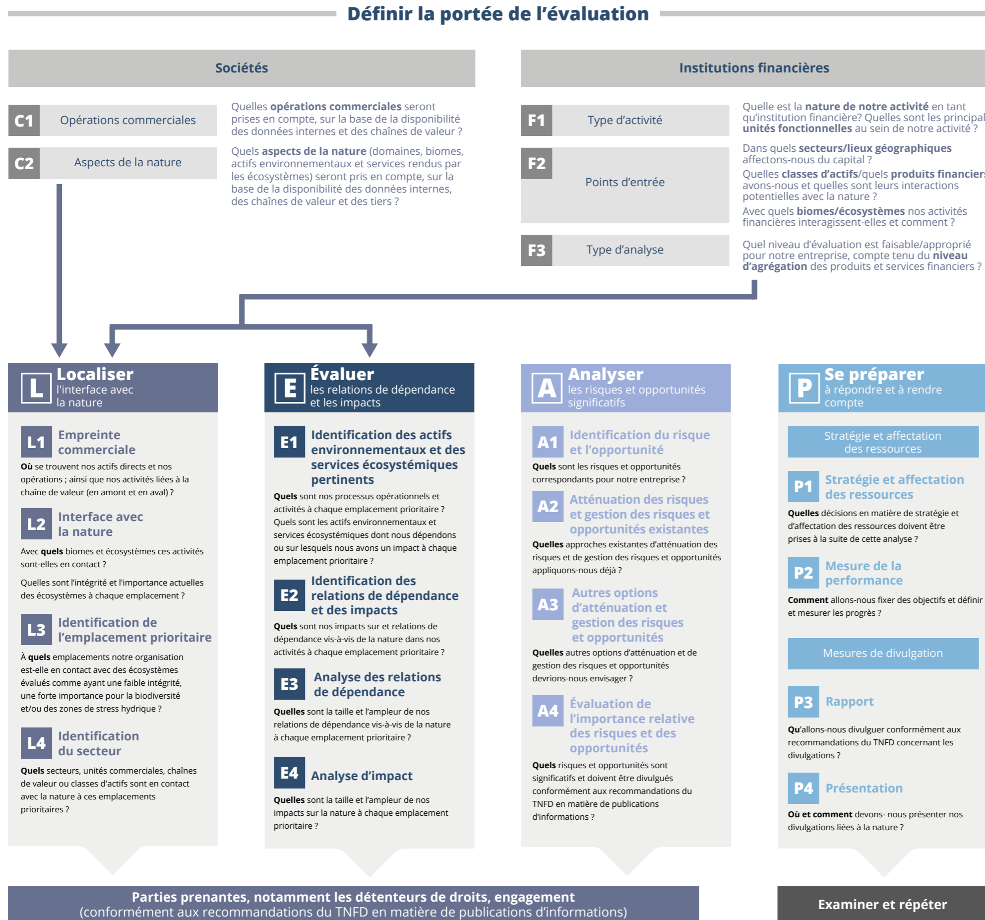
Figure 4 : L'approche révisée d'évaluation des risques et des opportunités (LEAP) du TNFD