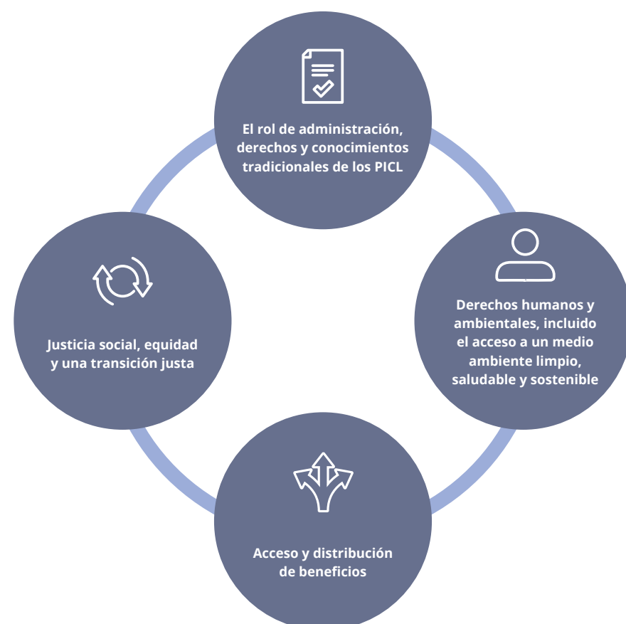
Figura 1: Dimensiones sociales clave relevantes para el diseño del marco de gestión y divulgación de riesgos relacionados con la naturaleza del TNFD

Cada una de estas dimensiones es compleja por sí misma, y muchas otras iniciativas han desarrollado o están desarrollando guías para las empresas y su financiación. Uno de los principios fundamentales del marco del TNFD es integrar las normas existentes y emergentes relevantes para su ámbito de aplicación. Por eso, en este documento se indican algunas de estas normas clave sobre dimensiones sociales pertinentes para la gestión y divulgación de los riesgos y oportunidades relacionados con la naturaleza.